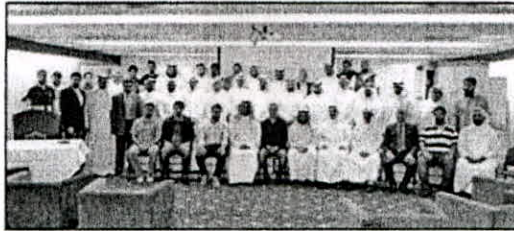
• الأثري وللمحيلي يتوسطان المهندسين

الذي تلقاه من الكثير من الجهات الحكومية. فلا زلنا نعاني من اعتبار كثير من الجهات العامة والخاصة أن الجمعية منافسا لها. رغم أن عملنا تطوعياً. ولا يزال لدينا الكثير من البرامج التي لا تلقى الدعم. وأدعو هذه الجهات التي تحقق التواصل معنا لترى أننا جبهة تعمل للارتقاء بالمهنة وكوارنا البشرية التي تعمل في القطاعين العام والخاص. نون النظر لأي مردود مادي. وأضاف أنه انطلاقاً من أهداف الجمعية في الارتقاء بالأداء الفني للمهندسين فإننا نرى أننا بأمر الحاجة إلى استراتيجية تدريبية للمهندسين وخاصة حديثي التخرج منهم. فنتطبيقات سوق العمل باتت متقدمة. ولتهيئة المهندس لمجال العمل لابد من تطبيق ما تعلمه في حل المشاكل الهندسية في الواقع